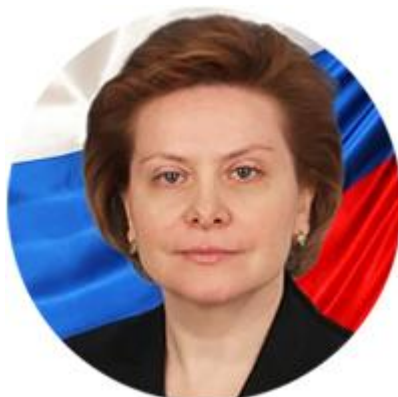
НАТАЛЬЯ КОМАРОВА ГУБЕРНАТОР ХАНТЫ- МАНСЙСКОГО АВТОНОМНОГО ОКРУГА — ЮГРЫ