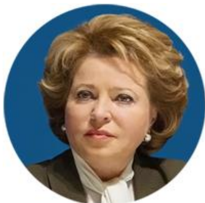
ВАЛЕНТИНА МАТВИЕНКО ПРЕДСЕДАТЕЛЬ СОВЕТА ФЕДЕРАЦИИ ФЕДЕРАЛЬНОГО СОБРАНИЯ РОССИЙСКОЙ ФЕДЕРАЦИИ (ПРЕДСЕДАТЕЛЬ ОРГАНИЗАЦИОННОГО КОМИТЕТА)