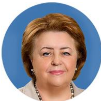
ЗИНАИДА ДРАГУНКИНА ПРЕДСЕДАТЕЛЬ КОМИТЕТА СОВЕТА ФЕДЕРАЦИИ ПО НАУКЕ, ОБРАЗОВАНИЮ И КУЛЬТУРЕ