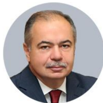
ИЛЬЯС УМАХОНОВ ЗАМЕСТИТЕЛЬ ПРЕДСЕДАТЕЛЯ СОВЕТА ФЕДЕРАЦИИ ФЕДЕРАЛЬНОГО СОБРАНИЯ РОССИЙСКОЙ ФЕДЕРАЦИИ