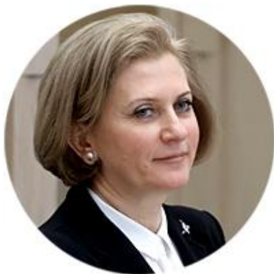
АННА ПОПОВА РУКОВОДИТЕЛЬ ФЕДЕРАЛЬНОЙ СЛУЖБЫ ПО НАДЗОРУ В СФЕРЕ ЗАЩИТЫ ПРАВ ПОТРЕБИТЕЛЕЙ И БЛАГОПОЛУЧИЯ ЧЕЛОВЕКА