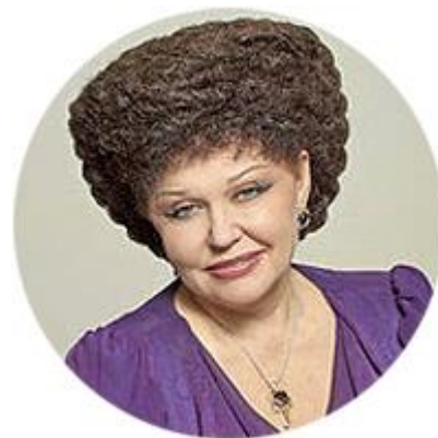
ВАЛЕНТИНА ПЕТРЕНКО ЧЛЕН КОМИТЕТА СОВЕТА ФЕДЕРАЦИИ ПО СОЦИАЛЬНОЙ ПОЛИТИКЕ