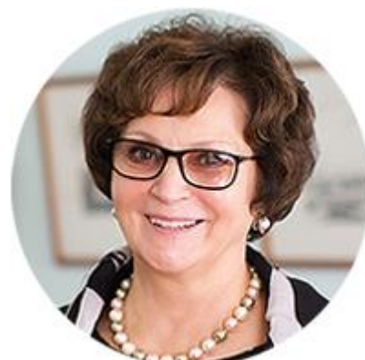
ЕКАТЕРИНА ЛАХОВА ЧЛЕН КОМИТЕТА СОВЕТА ФЕДЕРАЦИИ ПО ФЕДЕРАТИВНОМУ УСТРОЙСТВУ, РЕГИОНАЛЬНОЙ ПОЛИТИКЕ, МЕСТНОМУ САМОУПРАВЛЕНИЮ И ДЕЛАМ СЕВЕРА