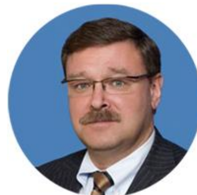
КОНСТАНТИН КОСАЧЕВ ПРЕДСЕДАТЕЛЬ КОМИТЕТА СОВЕТА ФЕДЕРАЦИИ ПО МЕЖДУНАРОДНЫМ ДЕЛАМ