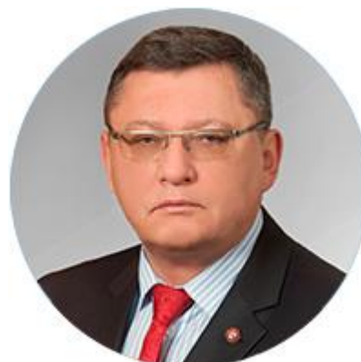
ИГОРЬ ЗУБОВ СТАТС-СЕКРЕТАРЬ – ЗАМЕСТИТЕЛЬ МИНИСТРА ВНУТРЕННИХ ДЕЛ РОССИЙСКОЙ ФЕДЕРАЦИИ