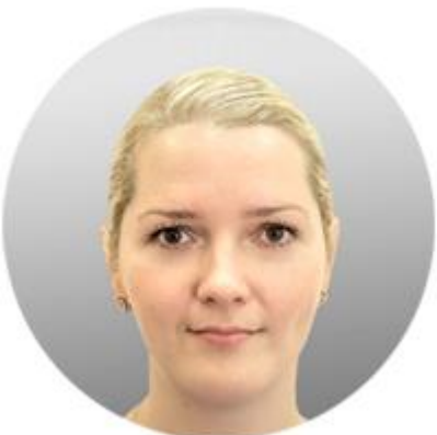
МАРИЯ КАЗАНСКАЯ ДИРЕКТОР ДЕПАРТАМЕНТА МЕЖДУНАРОДНОГО СОТРУДНИЧЕСТВА МИНИСТЕРСТВА СВЯЗИ И МАССОВЫХ КОММУНИКАЦИЙ РОССИЙСКОЙ ФЕДЕРАЦИИ