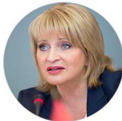
АЛЛА МАНИЛОВА ЗАМЕСТИТЕЛЬ МИНИСТРА КУЛЬТУРЫ РОССИЙСКОЙ ФЕДЕРАЦИИ