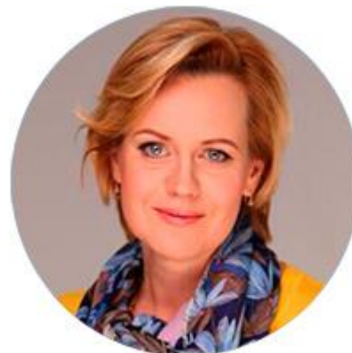
ЕЛЕНА ЯГОДКИНА НАЧАЛЬНИК ГЛАВНОГО УПРАВЛЕНИЯ ФЕДЕРАЛЬНЫХ ТАМОЖЕННЫХ ДОХОДОВ И ТАРИФНОГО РЕГУЛИРОВАНИЯ ФЕДЕРАЛЬНОЙ ТАМОЖЕННОЙ СЛУЖБЫ РОССИЙСКОЙ ФЕДЕРАЦИИ