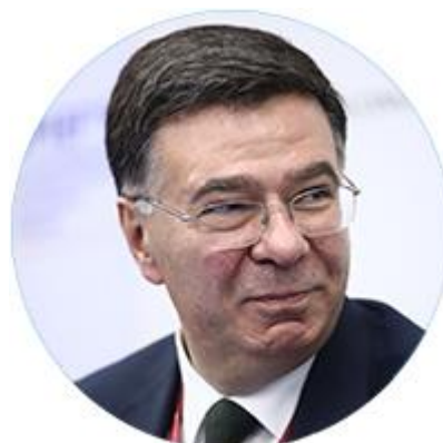
АЛЕКСАНДР ПАНКИН ЗАМЕСТИТЕЛЬ МИНИСТРА ИНОСТРАННЫХ ДЕЛ РОССИЙСКОЙ ФЕДЕРАЦИИ