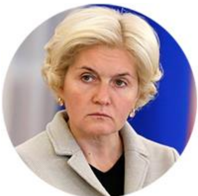
ОЛЬГА ГОЛОДЕЦ ЗАМЕСТИТЕЛЬ ПРЕДСЕДАТЕЛЯ ПРАВИТЕЛЬСТВА РОССИЙСКОЙ ФЕДЕРАЦИИ