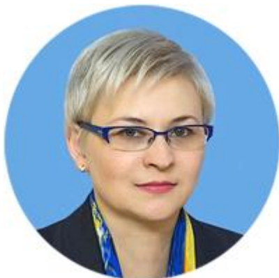
ЛЮДМИЛА БОКОВА ПЕРВЫЙ ЗАМЕСТИТЕЛЬ ПРЕДСЕДАТЕЛЯ КОМИТЕТА СОВЕТА ФЕДЕРАЦИИ ПО КОНСТИТУЦИОННОМУ ЗАКОНОДАТЕЛЬСТВУ И ГОСУДАРСТВЕННОМУ СТРОИТЕЛЬСТВУ