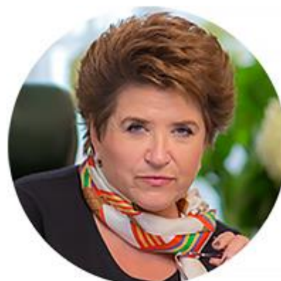
ЛЮБОВЬ ГЛЕБОВА ПЕРВЫЙ ЗАМЕСТИТЕЛЬ ПРЕДСЕДАТЕЛЯ КОМИТЕТА СОВЕТА ФЕДЕРАЦИИ ПО РЕГЛАМЕНТУ И ОРГАНИЗАЦИИ ПАРЛАМЕНТСКОЙ ДЕЯТЕЛЬНОСТИ