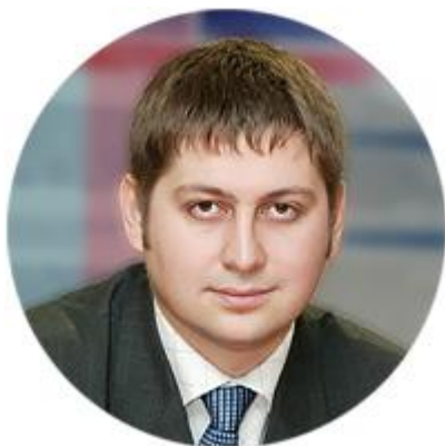
ОЛЕГ ФОМИЧЕВ СТАТС-СЕКРЕТАРЬ — ЗАМЕСТИТЕЛЬ МИНИСТРА ЭКОНОМИЧЕСКОГО РАЗВИТИЯ РОССИЙСКОЙ ФЕДЕРАЦИИ