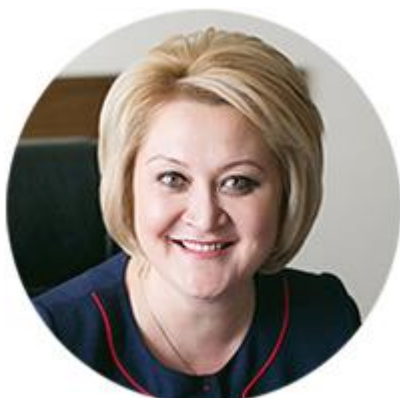
ЛИЛИЯ ГУМЕРОВА ПЕРВЫЙ ЗАМЕСТИТЕЛЬ ПРЕДСЕДАТЕЛЯ КОМИТЕТА СОВЕТА ФЕДЕРАЦИИ ПО НАУКЕ, ОБРАЗОВАНИЮ И КУЛЬТУРЕ