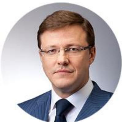
ДМИТРИЙ АЗАРОВ ИСПОЛНЯЮЩИЙ ОБЯЗАННОСТИ ГУБЕРНАТОРА САМАРСКОЙ ОБЛАСТИ