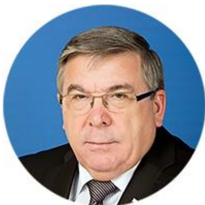
ВАЛЕРИЙ РЯЗАНСКИЙ ПРЕДСЕДАТЕЛЬ КОМИТЕТА СОВЕТА ФЕДЕРАЦИИ ПО СОЦИАЛЬНОЙ ПОЛИТИКЕ