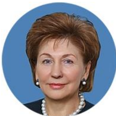
ГАЛИНА КАРЕЛОВА ЗАМЕСТИТЕЛЬ ПРЕДСЕДАТЕЛЯ СОВЕТА ФЕДЕРАЦИИ ФЕДЕРАЛЬНОГО СОБРАНИЯ РОССИЙСКОЙ ФЕДЕРАЦИИ (ЗАМЕСТИТЕЛЬ ПРЕДСЕДАТЕЛЯ ОРГАНИЗАЦИОННОГО КОМИТЕТА)