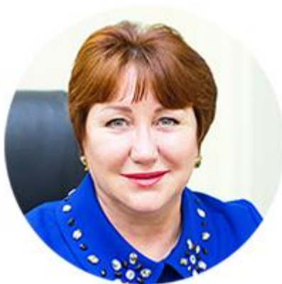
ЕЛЕНА ПЕРМИНОВА ЗАМЕСТИТЕЛЬ ПРЕДСЕДАТЕЛЯ КОМИТЕТА СОВЕТА ФЕДЕРАЦИИ ПО БЮДЖЕТУ И ФИНАНСОВЫМ РЫНКАМ