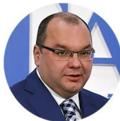
СЕРГЕЙ МИХАЙЛОВ ГЕНЕРАЛЬНЫЙ ДИРЕКТОР ФЕДЕРАЛЬНОГО ГОСУДАРСТВЕННОГО УНИТАРНОГО ПРЕДПРИЯТИЯ «ИНФОРМАЦИОННОЕ ТЕЛЕГРАФНОЕ АГЕНТСТВО РОССИИ (ИТАР-ТАСС)»