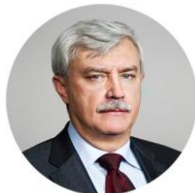
ГЕОРГИЙ ПОЛТАВЧЕНКО ГУБЕРНАТОР САНКТ-ПЕТЕРБУРГА (ЗАМЕСТИТЕЛЬ ПРЕДСЕДАТЕЛЯ ОРГАНИЗАЦИОННОГО КОМИТЕТА)