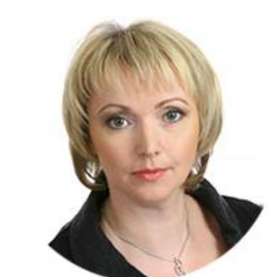
ИРИНА ГЕХТ ЗАМЕСТИТЕЛЬ ПРЕДСЕДАТЕЛЯ КОМИТЕТА СОВЕТА ФЕДЕРАЦИИ ПО АГРАРНО- ПРОДОВОЛЬСТВЕННОЙ ПОЛИТИКЕ И ПРИРОДОПОЛЬЗОВАНИЮ