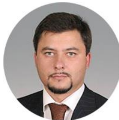
АЛЕКСЕЙ ВОВЧЕНКО ПЕРВЫЙ ЗАМЕСТИТЕЛЬ МИНИСТРА ТРУДА И СОЦИАЛЬНОЙ ЗАЩИТЫ РОССИЙСКОЙ ФЕДЕРАЦИИ