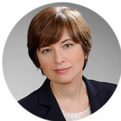
КСЕНИЯ ЮДАЕВА ПЕРВЫЙ ЗАМЕСТИТЕЛЬ ПРЕДСЕДАТЕЛЯ ЦЕНТРАЛЬНОГО БАНКА РОССИЙСКОЙ ФЕДЕРАЦИИ