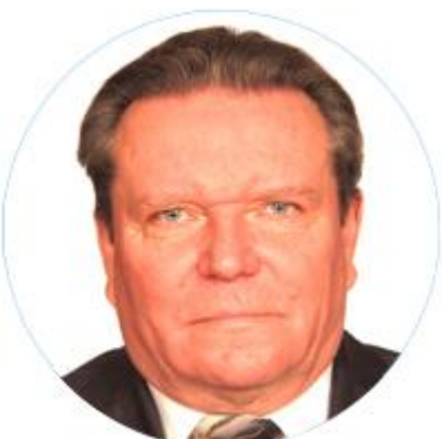
АЛЕКСАНДР КУДРЯШОВ ЗАМЕСТИТЕЛЬ РУКОВОДИТЕЛЯ СЛУЖБЫ ОХРАНЫ ПО СЕВЕРО- ЗАПАДНОМУ ФЕДЕРАЛЬНОМУ ОКРУГУ ФЕДЕРАЛЬНОЙ СЛУЖБЫ ОХРАНЫ РОССИЙСКОЙ ФЕДЕРАЦИИ