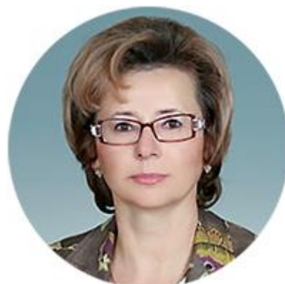
НАТАЛЬЯ ПАРШИКОВА СТАТС-СЕКРЕТАРЬ — ЗАМЕСТИТЕЛЬ МИНИСТРА СПОРТА РОССИЙСКОЙ ФЕДЕРАЦИИ