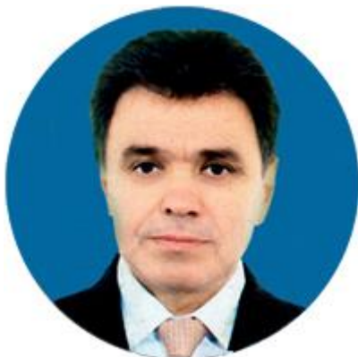
ЛЕВ ЩЕРБАКОВ ПЕРВЫЙ ЗАМЕСТИТЕЛЬ РУКОВОДИТЕЛЯ АППАРАТА СОВЕТА ФЕДЕРАЦИИ ФЕДЕРАЛЬНОГО СОБРАНИЯ РОССИЙСКОЙ ФЕДЕРАЦИИ