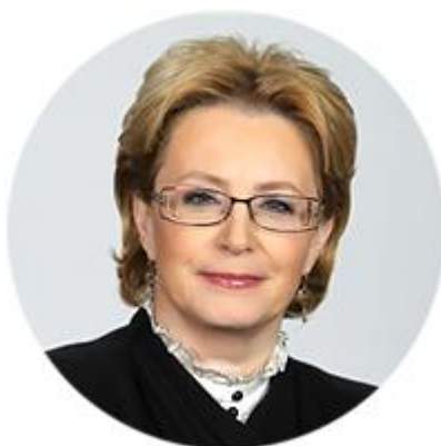
ВЕРОНИКА СКВОРЦОВА МИНИСТР ЗДРАВООХРАНЕНИЯ РОССИЙСКОЙ ФЕДЕРАЦИИ