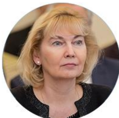
МАРИНА ЛАРИОНОВА ВИЦЕ-ПРЕЗИДЕНТ — УПРАВЛЯЮЩИЙ ДИРЕКТОР УПРАВЛЕНИЯ МЕЖДУНАРОДНОГО СОТРУДНИЧЕСТВА РОССИЙСКОГО СОЮЗА ПРОМЫШЛЕННИКОВ И ПРЕДПРИНИМАТЕЛЕЙ