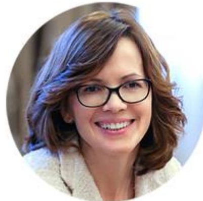
ГУЛЬНАЗ КАДЫРОВА ЗАМЕСТИТЕЛЬ МИНИСТРА ПРОМЫШЛЕННОСТИ И ТОРГОВЛИ РОССИЙСКОЙ ФЕДЕРАЦИИ