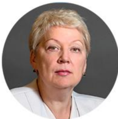
ОЛЬГА ВАСИЛЬЕВА МИНИСТР ОБРАЗОВАНИЯ И НАУКИ РОССИЙСКОЙ ФЕДЕРАЦИИ